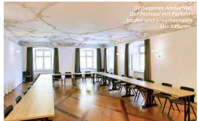
Gediegenes Ambiente: Der Festsaal mit Parkett- boden und ornamentalen Stuckaturen.