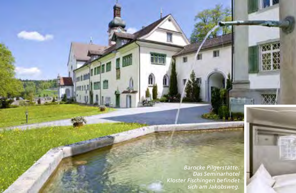
Barocke Pilgerstätte: Das Seminarhotel Kloster Fischingen befindet sich am Jakobsweg.