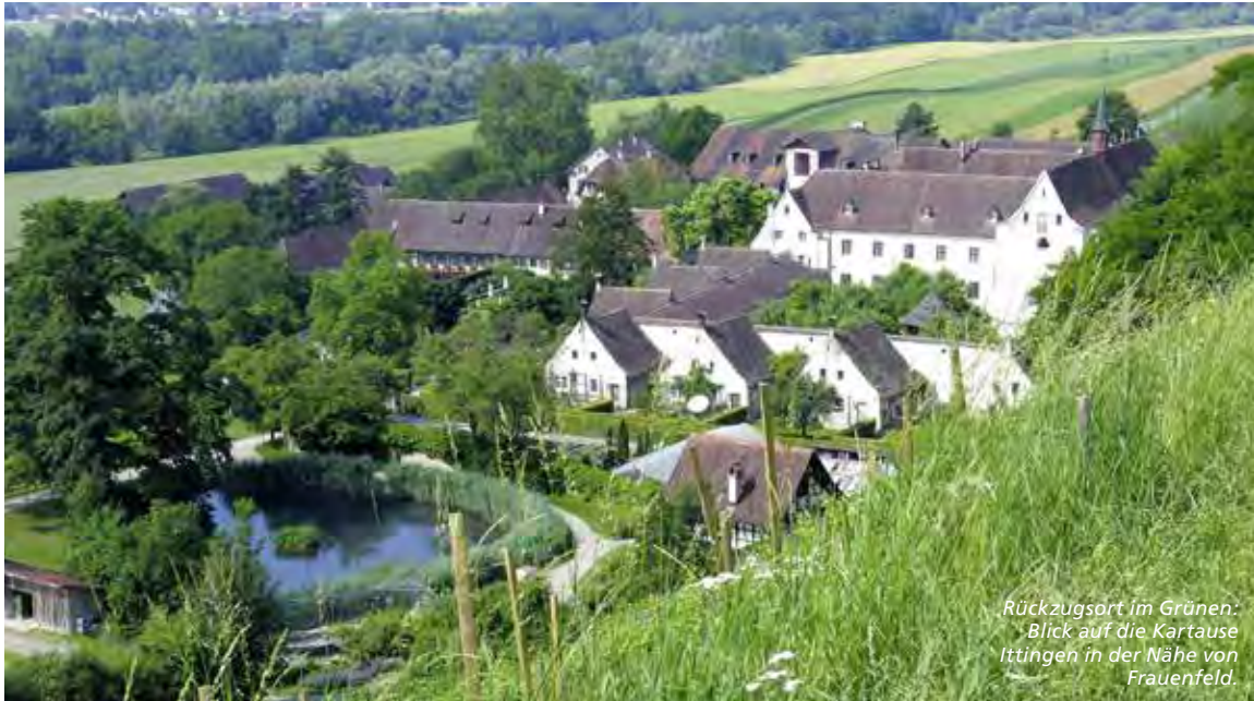
Rückzugsort im Grünen: Blick auf die Kartause Ittingen in der Nähe von Frauenfeld.