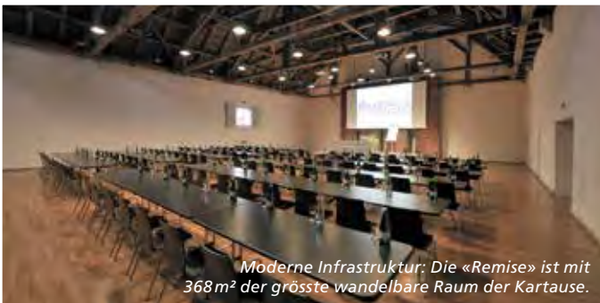
Moderne Infrastruktur: Die «Remise» ist mit 368 m 2 der grösste wandelbare Raum der Kartause.